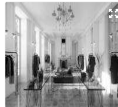
L'intérieur de l'hôtel de Coulanges, Paris 4. © SK & Associés

C'est en 1972 que la Ville de Paris rachète l'hôtel de Coulanges, afin de le sauver de la destruction qui l'attend. Rénové à partir de 1975 , le bâtiment rouvre ses portes en 1978 pour accueillir la Maison de l'Europe de Paris, qui quittera finalement les lieux au printemps 2017. En signant le bail à construction, les Hazan réalisent la restructuration complète du site entre 2018 et 2020, via l'injection de 9 M€ de capex selon Le Monde . S'appuyant sur le cabinet d'architecture SK & Associés , le but est de créer « un lieu