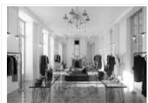
HÔTEL DE COULANGES (35-3...