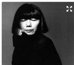
Rei Kawakubo, Comme des Garçons

Certifié NF HQE très bon et labellisé HPE Effinergie BBC rénovation 2009, l'hôtel de Coulanges est entièrement occupé via un bail 6/9/10 , depuis mars 2021, par Dover Street Market – le concept-store dirigé par Adrian Joffe , également président de Comme des Garçons, la griffe japonaise lancée en 1969 par sa femme, la très respectée Rei Kawakubo . Le loyer généré est drivé à 73 % par le retail selon nos informations. Le lieu est tout d'abord occupé par un centre culturel